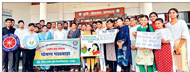
बेमेतरा

रेवेंडू सिंह वर्मा कृषि महाविद्यालय एवं अनुसंधान केंद्र, बेमेतरा में भारत सरकार के महिला एवं बाल विकास विभाग की महत्वाकांक्षी योजना "पोषण पखवाड़ा" के अंतर्गत जागरूकता कार्यक्रम का आयोजन किया गया। यह कार्यक्रम राष्ट्रीय सेवा योजना के स्वयंसेवकों द्वारा आयोजित किया गया, जिसमें छात्र-छात्राओं एवं संकाय सदस्यों की सक्रिय भागीदारी रही। वर्ष 2026 में आयोजित यह 8वां पोषण पखवाड़ा है, जिसका मुख्य विषय "जीवन के पहले छह वर्षों में मस्तिष्क के विकास को अधिकतम करना" निर्धारित किया गया है। कार्यक्रम के दौरान बच्चों के प्रारंभिक विकास,