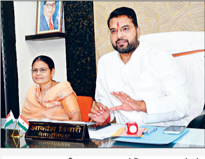
■ 100 एकड़ जमीन का मामला, बोरियाकला इलाके के ओमनगर, साई नगर बिलाल नगर क्षेत्र की फाइल

रायपुर नगर निगम में टीएनसी और मार्ग संरचना अप्रवृल के नाम पर 69 भूखंडों की फाइल गायब हो गई हैं। नगर निगम जोन 10 के कामरेड सुधीर मुखर्जी वार्ड में आरडीए कालोनी से लगे बोरियाखुर्द, ओम नगर, साई नगर, बिलाल नगर क्षेत्र के भूखंडों से जुड़ा मामला है। यह फाइल जोन कार्यालय से निगम मुख्यालय के बजाय सीधे नगर निवेश विभाग जो आवास एवं पर्यावास विभाग के अधीन होता है, उसे भेज दी गई। मामला सामने आते ही जोन कमिश्नर को मुख्यालय अटैच किया गया है। निगम आयुक्त ने इस मामले की जांच के लिए एक टीम भी बनाई है।